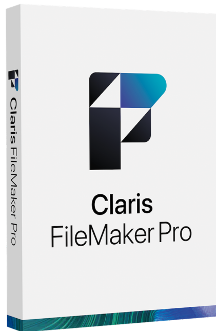
Claris FileMaker 2023